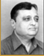
ડૉ. ચંદ્રકાંત મહેતા જાણીતા લેખક

આ વિવાદ જ સાવ અસ્થાને છે. એ વખતે લોકોએ જે માથાં ઊંચક્યાં. જે હિંમત દાખવી અને જે કુરબાનીઓ આપી આપણને તો એનું ગૌરવ હોવું જોઈએ. એ વિપ્લવ બળવો હતો કે સ્વાતંત્ર્ય સંગ્રામ એવા નકામા વિવાદમાં પડવાની કોઈ જરૂર નથી. આ કામ ઇતિહાસકારોનું છે.