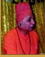
સ્વામી સચ્ચિદાનંદ દંતાલી આશ્રમ

બધા લોકો એને બળવો કહે છે. રાષ્ટ્રવ્યાપી બળવો! મારું પણ માનવું છે કે એ બળવો જ હતો અને બળવા બાદ જે પરિણામ આવ્યું એ સારું જ આવ્યું. જો અંગ્રેજોની જગ્યાએ ફરી મુઘલ સામ્રાજ્ય આવ્યું હોત તો ભારતમાં રાજા રજવાડાઓના એ જ યુદ્ધો અને અંદર અંદરની હુંસાતુંસી ચાલુ રહી હોત. અંગ્રેજોએ ત્યારબાદ ૭૦ વર્ષના તેમનાં શાસનમાં ઘણું બધું આપ્યું.